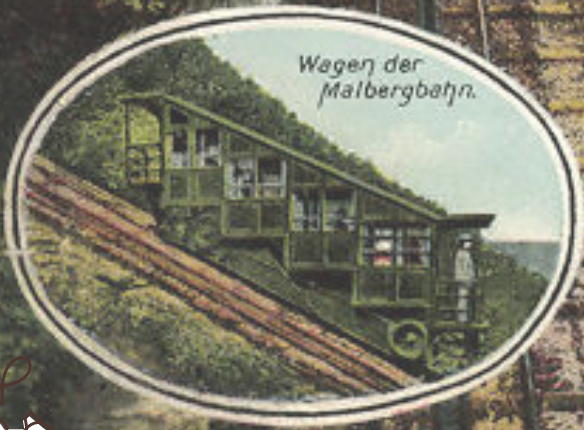
Wagen der Malbergbahn.