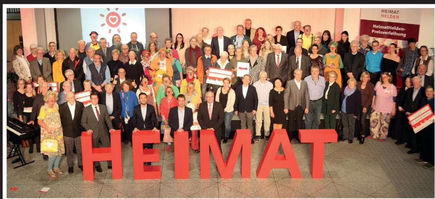
Die HeimatHelden aus dem Jahr 2019 freuen sich gemeinsam über die Auszeichnung und die finanzielle Unterstützung von insgesamt 25.000 Euro.

Sparkasse Koblenz würdigt ehrenamtliches Engagement mit 25.000 Euro